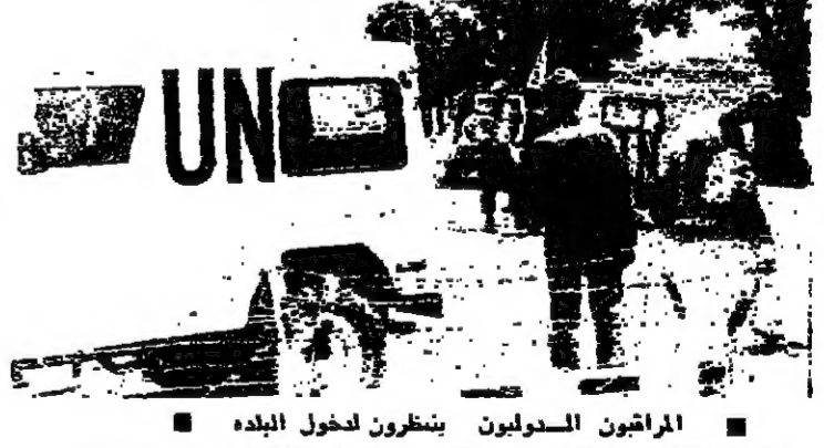
المرشون السودانيون ينظرون لدخول البلدة